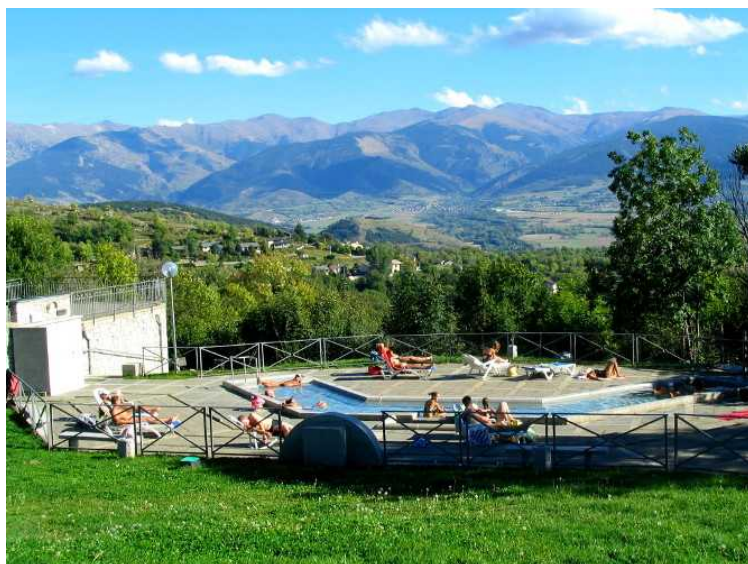
Les Bains Romains de Dorres

Les Bains de Dorres sont à quelques pas du gîte. On se baigne en plein air dans une eau thermale sulfureuse à 39 °C réputée pour soulager l'arthrose et les rhumatismes. L'eau thermale rend également la peau plus douce. Vous pratiquerez la balnéo en plein air sous le soleil après la promenade ou une activité sportive, dans un cadre apaisant avec vue sur la chaîne des montagnes.